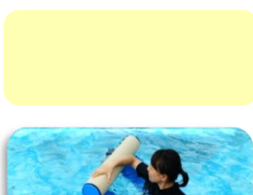
横向きにして座れる！