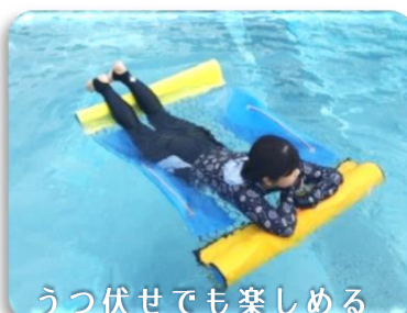
うつ伏せでも楽しめる